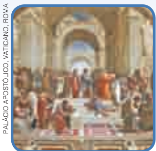
PALÁCIO APOSTÓLICO, VATICANO, ROMA