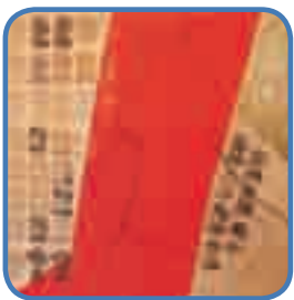
CORTESIA DA ARTISTA OLÍVIA NEMEYER - COLEÇÃO PARTICULAR