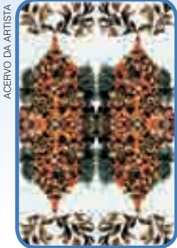
ACERVO DA ARTISTA