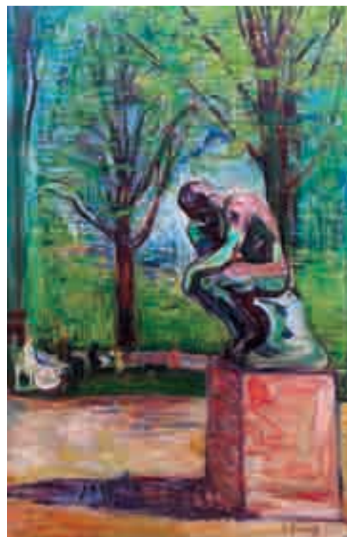
AKG IMAGES - LATINSTOCK - MUSEU RODIN, PARIS

A reflexão filosófica, indagativa, do ser humano, foi tema de uma obra famosa do escultor francês Auguste Rodin (1840-1917): O pensador , de 1881. O pintor norueguês Edvard Munch (1863-1944), conhecedor da arte de Rodin, prestou-lhe uma homenagem, reproduzindo em sua pintura O pensador de Rodin , de 1907, a célebre escultura que o inspirou.